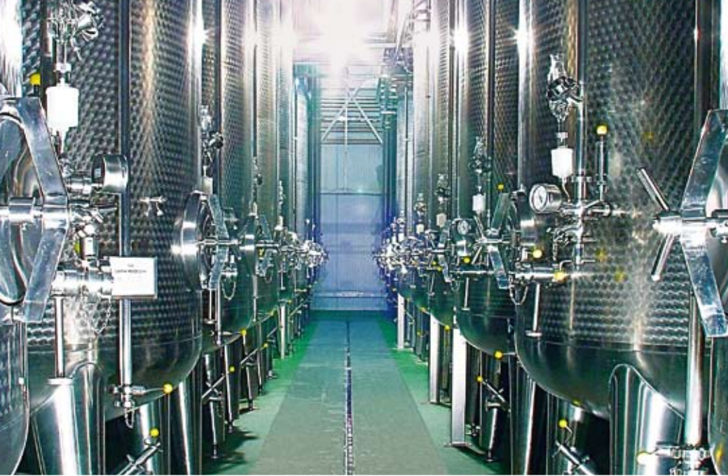
Cuves de conservation KZE O.K. Ovocowe Koncentraty Przeworsk Pologne