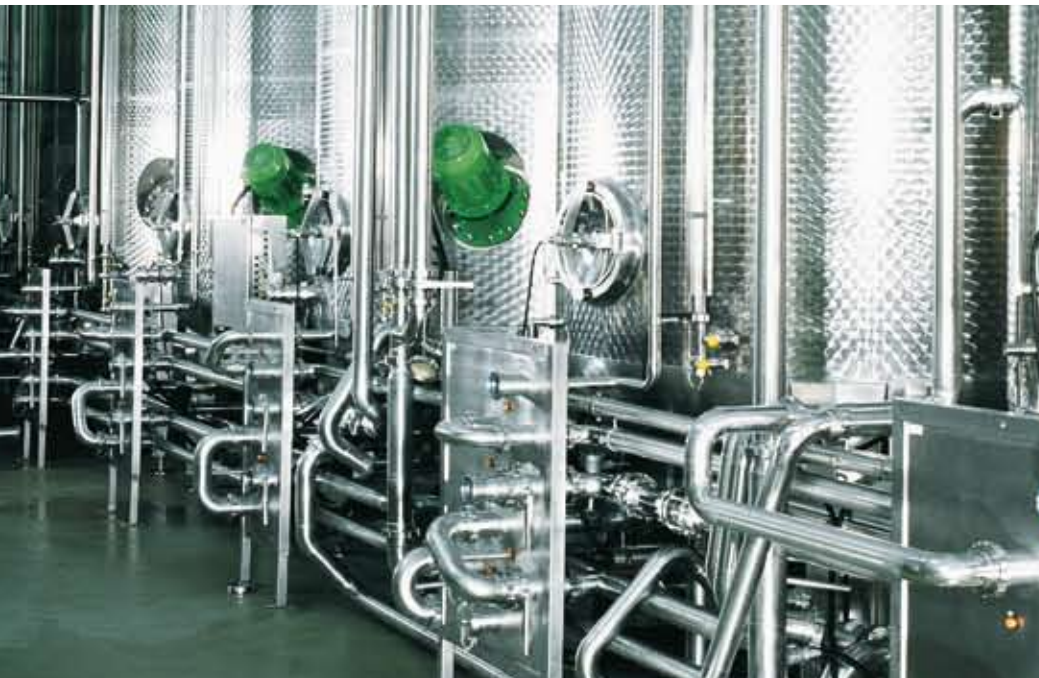
Cuves de mélanges, Richard Sauer Utilisation des fruits, Dachwig

Avec leur savoir-faire sectoriel approfondi, nos spécialistes accompagnent l'ensemble du processus de production – de la préparation de la production jusqu'au contrôle final en passant par la fabrication.