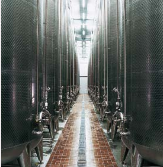
Société de transformation des fruits Dreher, Stockach