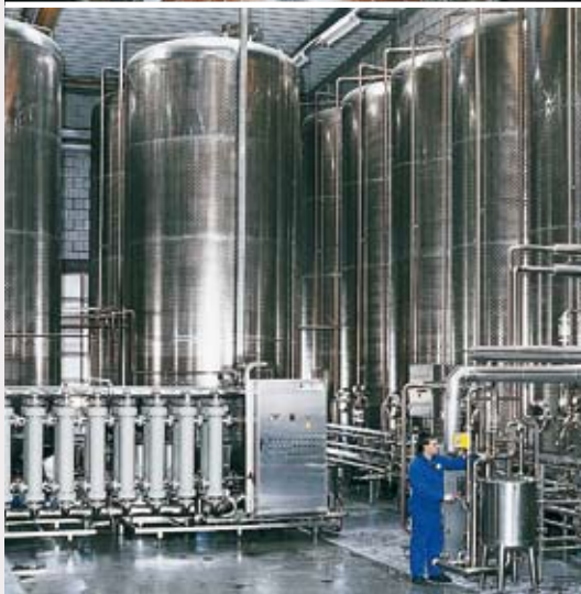
Bauer & Schindel, Bad Liebenwerda